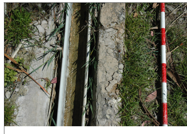
Descripción: Acequia en detalle.