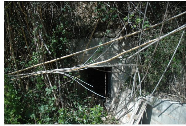
Descripción: Boca transformada de la font de mina.