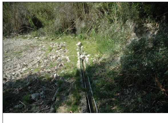
Descripción: Acequia que canaliza el agua desde la font de mina al safareig.