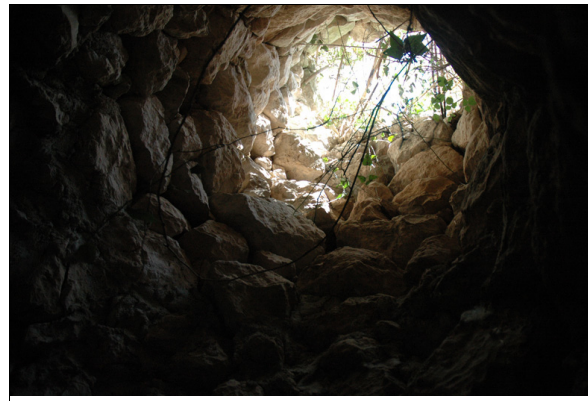
Descripción: Salida de aire de la font de mina.