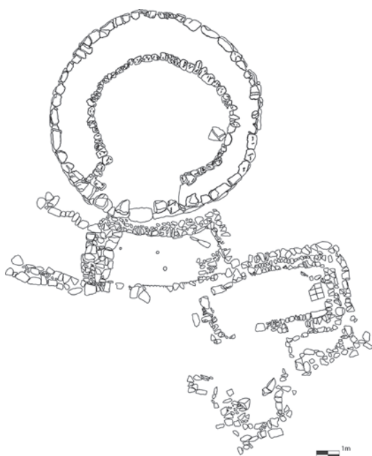
Figura 102. Planimetría de las habitaciones almohades adosadas a la Torre III del Puig de sa Morisca.

de mediano y pequeño tamaño, aunque, en ocasiones, se reaprovechan grandes bloques procedentes de la torre prehistórica. En las habitaciones 1 y 3 se han hallado sendos hogares adosados a las paredes norte y oeste. La presencia de estas habitaciones y hogares nos indica que, probablemente, este yacimiento habría contado con una ocupación permanente.