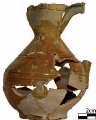
Figura 107. Jarrita hallada en el Puig de sa Morisca (García Amengual et al. 2010).

Finalmente, se han podido documentar algunas cuevas que presentan indicios de ocupación durante el periodo islámico y que probablemente se utilizaron como lugar de refugio y obtención de recursos hídricos. También se ha podido establecer, a partir de la ubicación de los núcleos habitados, la existencia de diversos caminos de probable origen medieval, que comunicaban y articulaban unos territorios con otros.