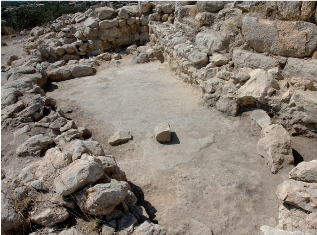
Figura 103. Habitación central de época almohade de la Torre III del Puig de sa Morisca.

del yacimiento como núcleo de vigilancia costera queda constatado en una carta náutica del imperio otomano datada en 1574 (Werner 2004). En esta carta, que representa elementos del siglo XIV que constituyen referentes visuales costeros, destaca la ausencia del asentamiento en cuestión.