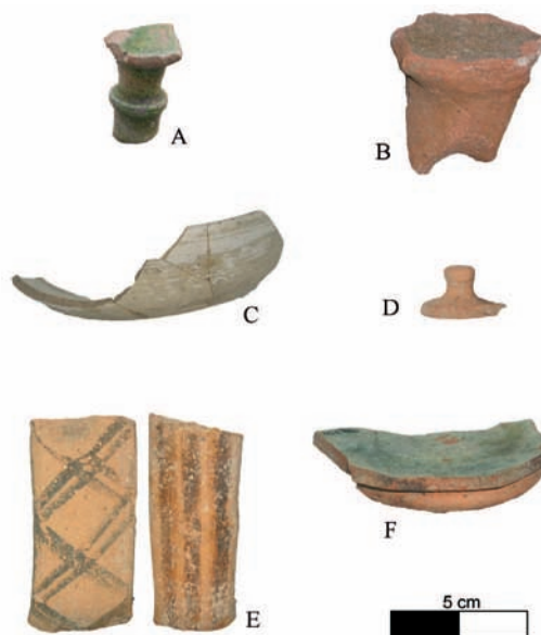
Figura 105. Cerámicas procedentes de los yacimientos de Cas Saboners (A y B) y la Torre III del Puig de sa Morisca (C-F).

Este asentamiento aparece documentado en el Llibre dels Feyts , en el que se cita la existencia de tiendas y de la presencia de un ... campamento de tropas compuestas por 2.000 sarracenos (Puyol 2003: 86-90). También la crónica árabe de la conquista indica que el walí trató sin éxito de evitar el desembarco cristiano en Santa Ponça: Envià el vali un grup de gent per interceptar el seu avenç (de los cristianos) i aturar el desembarcament en aquell indret (Al-Mahzumi 2008: 102). La ubicación estratégica de este yacimiento, junto al paso natural del Coll de sa Batalla y la escasa