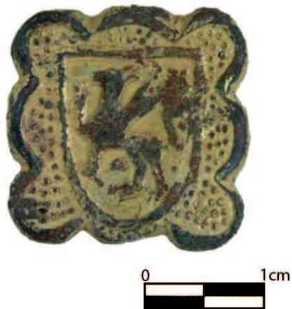
Figura 104. Pinjante con un grifo alado recubierto con una amalgama de oro hallado en el Puig de sa Morisca.

la bahía de Santa Ponça, especialmente de su puerto natural.