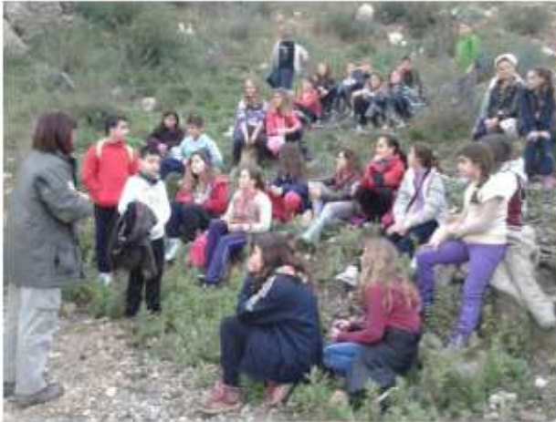
Puig de Sa Ginesta y Puig de Na Morisca