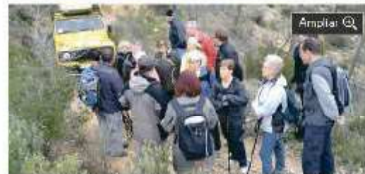
Turistas que participaron en la jornada de replantación.

I. m. calvià Una veintena de turistas han participado esta semana en labores de reforestación en las zonas de Peguera afectadas por incendios. En la iniciativa colaboran la Oficina Calvià por el Clima, el departamento municipal de Medio Ambiente y la Conselleria de Medio Ambiente. También cuenta con el apoyo de las asociaciones hoteleras de Santa Ponça, Peguera y Palmanova-Magaluf. El objetivo de la iniciativa es plantar cerca de 600 árboles, sobre todo pino y acebuche. En la semana de la reforestación, participan además alumnos del IES Calvià y de los colegios Puig de sa Morisca, Puig de sa Ginesta y ses Rotes Velles.