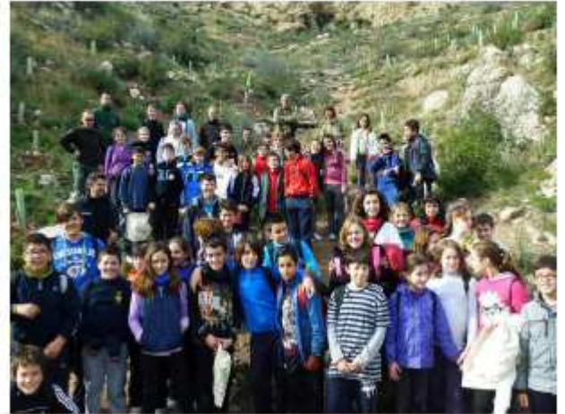
CEIP Ses Rotes Velles