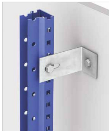
Unión de estanterías sencillas a los muros