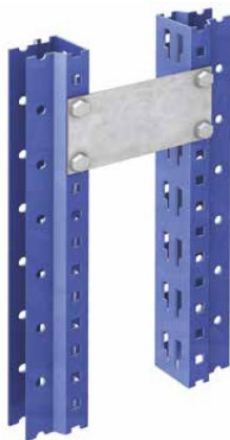
Unión de estanterías dobles