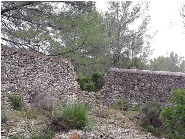
Detalles de la pared del tramo 1