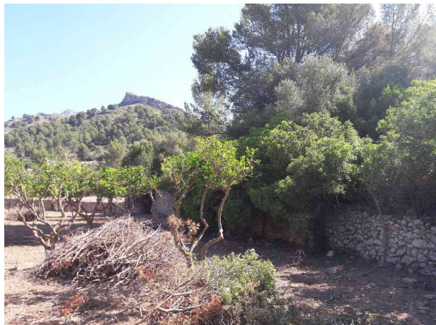
Detalles de la pared del tramo 2