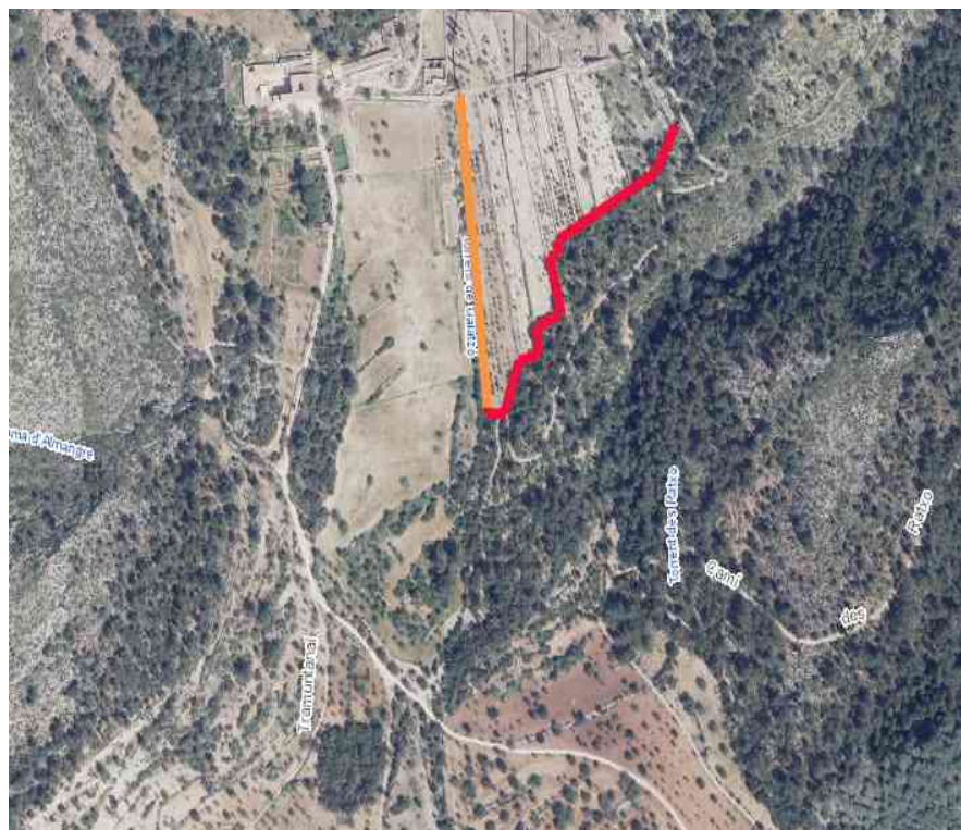
Delimitación de los marges a restaurar: Tramo 1 (color rojo) y tramo 2 (color naranja)