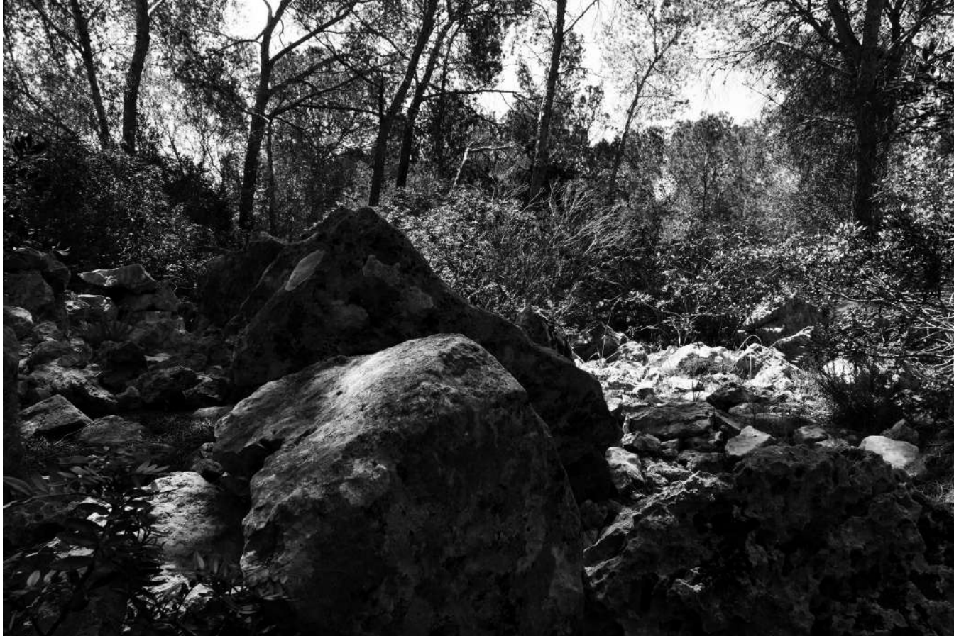
Santa Ponça 20 | Casa. Probablement dels segles III-I a. de C. Cultura posttalaiòtica. Nova Santa Ponça.