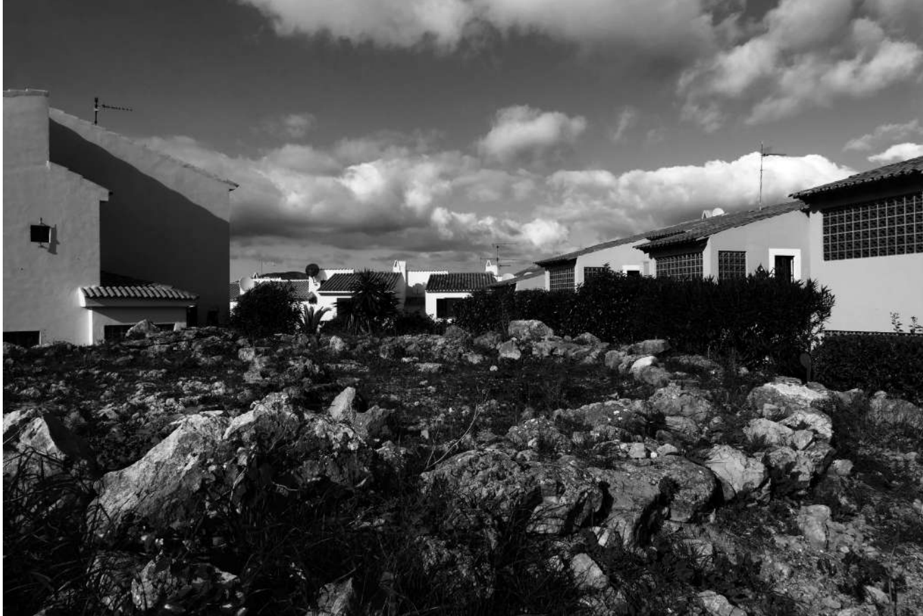
King's Park | Casa. Segles III-I a. de C. Cultura posttalaiòtica. Nova Santa Ponça.