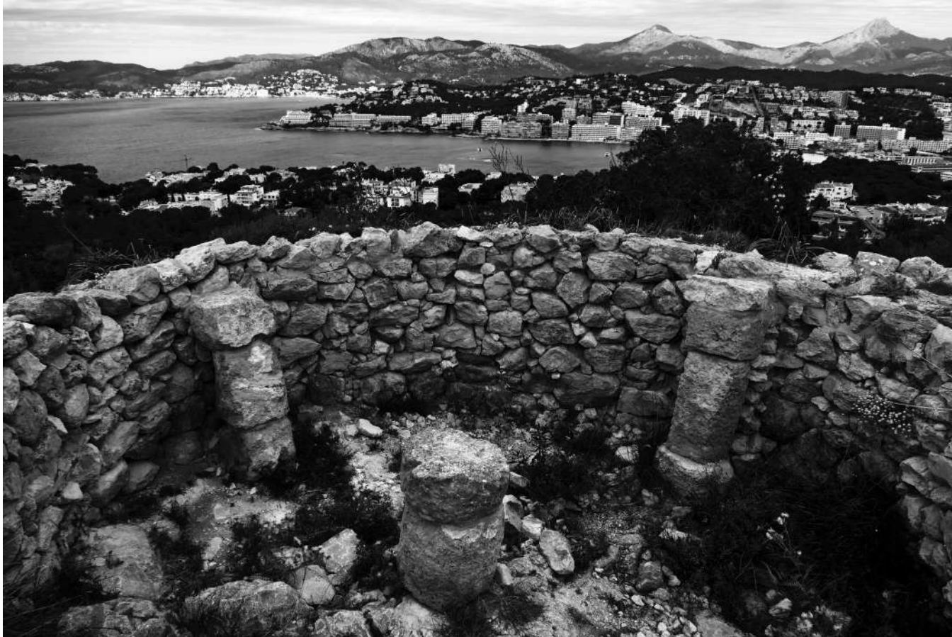
Torre III | Puig de sa Morisca. Torre de control visual. 850-800 a. de C. Cultura talaiòtica. Nova Santa Ponça.