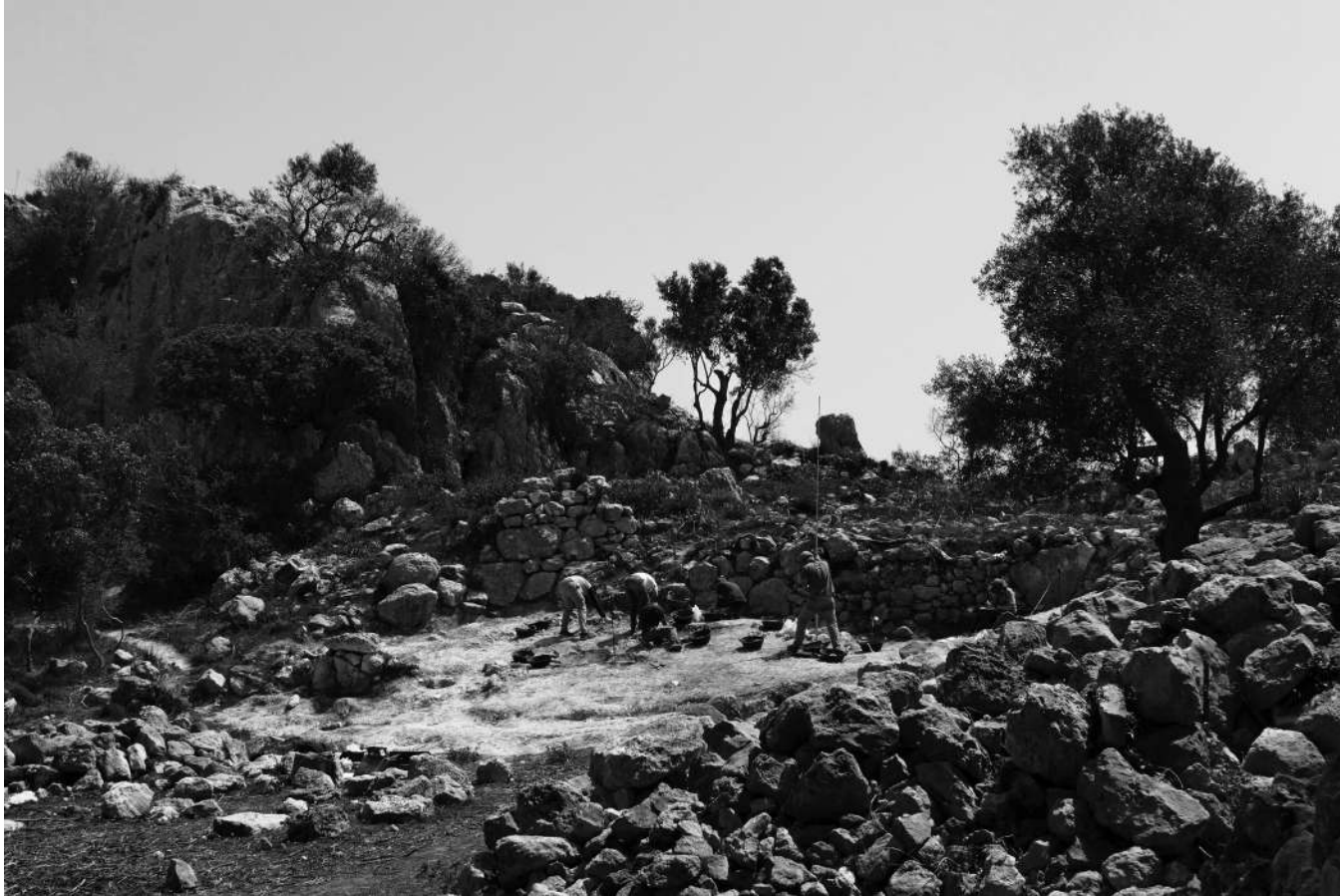
Excavació a la zona exterior del poblat | Zona poblat oest. Puig de sa Morisca. Segles V-I a. de C. Cultura posttalaiòtica. Nova Santa Ponça.