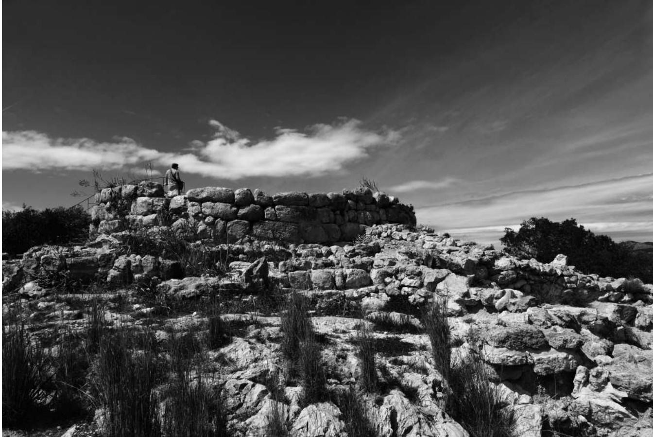
Torre III | Puig de sa Morisca. Torre de control visual. 850-800 a. de C. Cultura talaiòtica. Nova Santa Ponça.